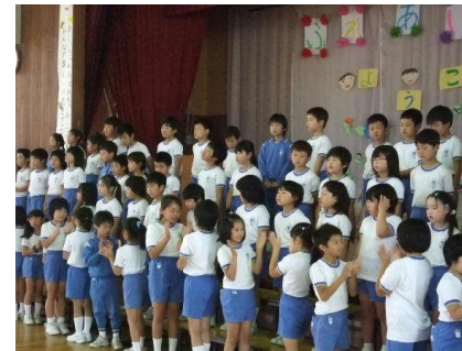
みんなで歌った「茶つみ」

40名あまりのお年寄りの方が「遊びの先生」として来校されました。お年寄りの方に、昔の遊び(おじゃめ・ぶんぶんごま・わりばしてっぼう)を紹介してもらい、グループに分かれて昔の遊びに挑戦しました。活動の中では、子どもたちの一生懸命さがたくさん見られました。また、質問タイムには、昔の戸出の様子、子どもの頃の遊びや学校での話などを聞き、今の生活との違いを知り驚いていました。その後、一緒に給食を食べて、楽しいひとときを過ごしました。