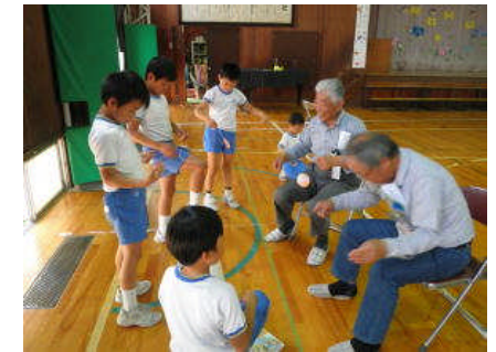
楽しかったふれあいタイム(ぶんぶんごま)

この活動は、2学期にも継続して行う予定です。回数を重ねることで、さらに交流を深め、お年寄りの方への思いやりの心を育てたり、ふれあうことの楽しさを味わったりしたいと考えています。