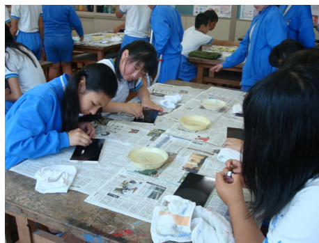
中塗りとぎの様子