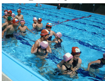
「手をつないで一緒に歩こうね」