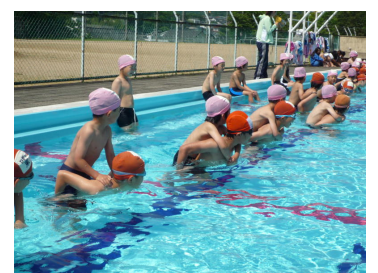
「おんぶしてもらおうとプールは怖くないよ」