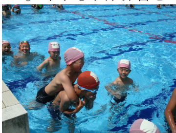
「おんぶしてもらってうれしいな」

模範泳法だけは、予定通り行うことができましたが、あいにくの天候のため1年生との初泳ぎは、延期になりました。6月17日、今度は青空の下、1年生との初泳ぎをしました。1年生をおんぶしたり、シャワーの浴び方を教えたりと、すっかり上級生の顔つきで1年生にやさしく教えていました。プールの後、「楽しかった。」という声が、6年生からも1年生からも聞こえてきました。今年も水泳練習をがんばることと思います。